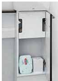
手洗い器キャビネット