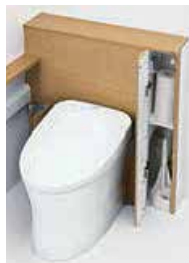
大便器キャビネット